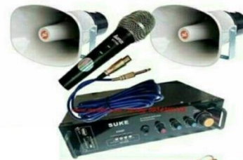
สายลำโพง 10 เมตร 21 เส้น ๒. เครื่องขยายเสียง AC - DC 12 V.