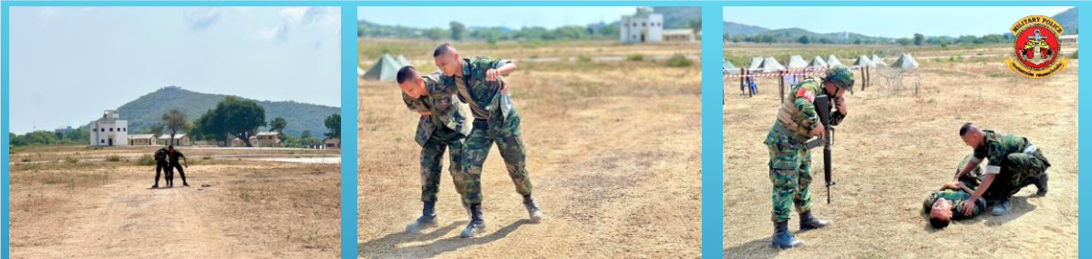
ประเภทบาดเจ็บ ( WOUNDED )

ทหารพลัดหน่วยประเภทบาดเจ็บ สารวัตรทหารจะดำเนินการวิธีส่งกับตามสายแพทย์โดยเร็วที่สุด ลักษณะบาดแผลเป็นสิ่งที่บอกว่าจะต้องดำเนินการส่งกลับโดยเร็วอย่างไร