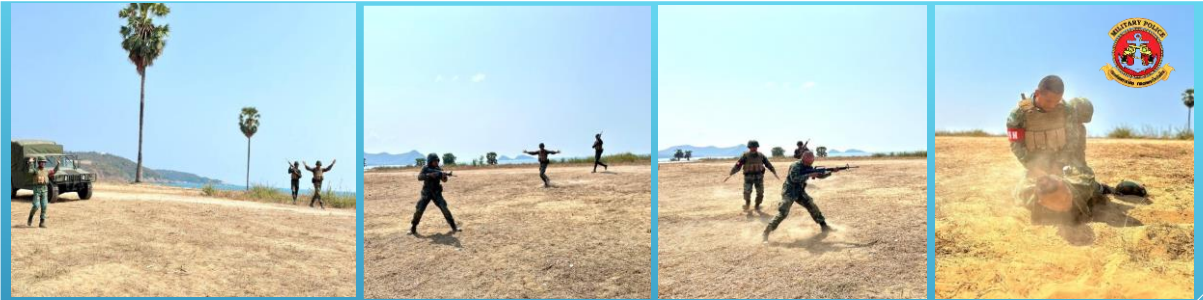
ประเภทหวาดกลัว ( FIAR )

ทหารพลัดหน่วยประเภทเกิดจากความกลัว จะเป็นทหารพลัดหน่วยประเภทที่อันตรายที่สุด อาจใช้อาวุธขึ้นมาต่อสู้ได้ ผู้เข้าทำการควบคุมหรือจับกุมต้องใช้ระมัดระวังเป็นพิเศษ เมื่อควบคุมและจับตัวได้ จะต้องรีบปลดอาวุธทันที การนำตัวส่งกลับจะต้องมีเจ้าหน้าที่คอยควบคุมคุ้มกันตลอดเวลาและแยกอาวุธออกจากตัว ดำเนินการส่งตามสายแพทย์ต่อไป