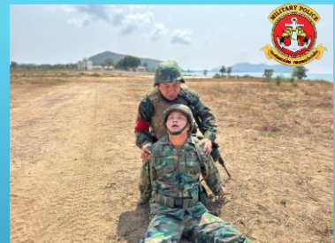
ประเภทตกตะลึง (SHOCK)