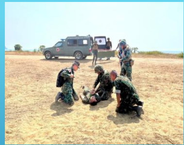
ประเภทบาดเจ็บ ( WOUNDED )